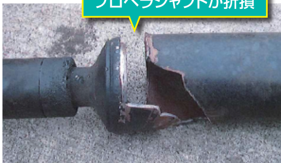
プロペラシャフトが折損